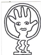
Erwin und Gretel Eisch-Stiftung

Die Ausfahrt auf der A 3 von Regensburg kommend ist Wörth-Ost , von Passau kommend Kirchroth .